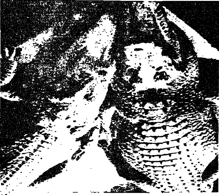
يلحان فيهما لتناول الفطور

في مستنقع قريب من الغابة. يتطير الريش وترتفع أصوات الضج وطحن العظام. التماسيح تستمتع بوجبة من الدجاج المذبح وزنها نصف طن.